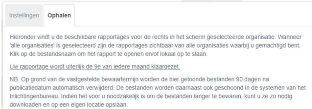
Afbeelding 3: Tabblad Ophalen

Op grond van de vastgestelde wettelijke bewaartermijn is een rapport 90 dagen op het portaal zichtbaar en zal vervolgens worden verwijderd. Indien u de rapporten langer wilt bewaren kunt u ze downloaden en lokaal opslaan.