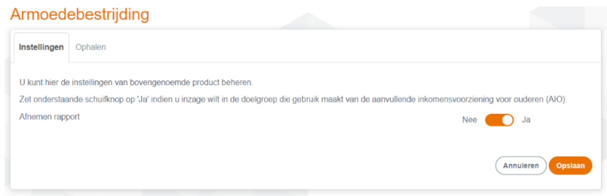
Afbeelding 2: tabblad Instellingen: Zet de schuifknop op 'Ja' om het rapport af te nemen

Let op! Geeft u aan geen gebruik te willen maken van het product Armoedebestrijding (rapport AOW met AIO)? Dan is het niet mogelijk om met terugwerkende kracht rapportages op te vragen.